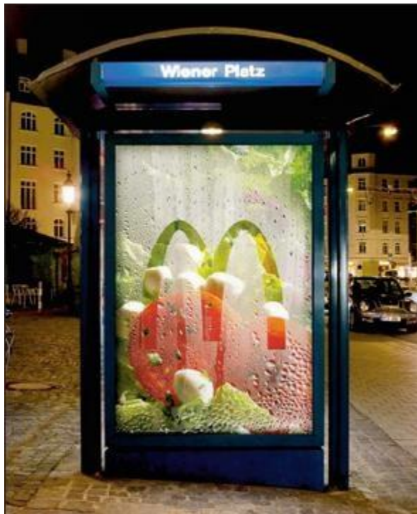
Kreativně zpracované medium na MC Donald's