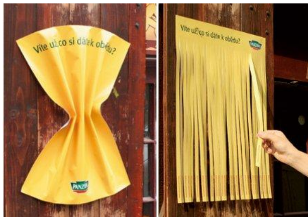
Kreativně ztvárněná reklama na těstoviny Panzani